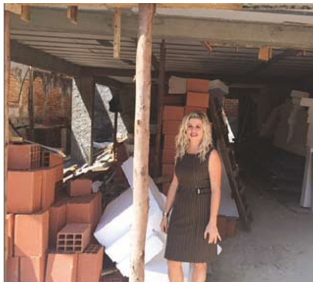
Foto com visão futurística da nova Casa do Trabalhador dá a dinâmica de como será bela a sede própria do SINTHOJUR