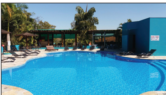
COLÔNIA DE FÉRIAS DE SALTO GRANDE