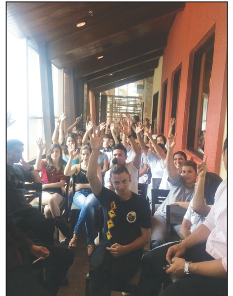
Funcionários do Outback de Jundiá em assembleia realizada pelo sindicato.

Segundo a lei, tanto os 10% normalmente cobrados pelo estabelecimento, quanto qualquer valor a mais dado pelo cliente, tudo é considerado gorjeta, pois a gratificação não é uma receita dos patrões, mas dos funcionários.