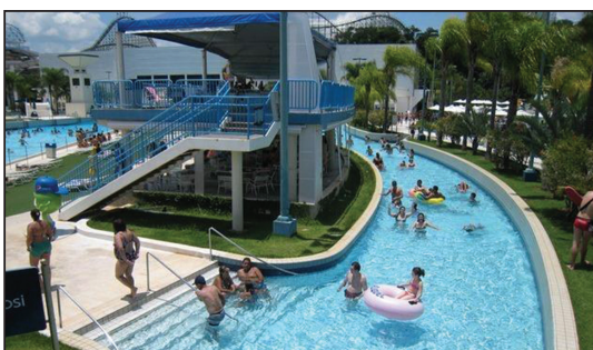
PARQUE AQUÁTICO WET'N WILD

O SINTHOJUR sempre busca parcerias que possibilitem que os filiados e seus dependentes tenham acesso ao lazer, à cultura e a diversão. Afinal a vida não é só trabalho!